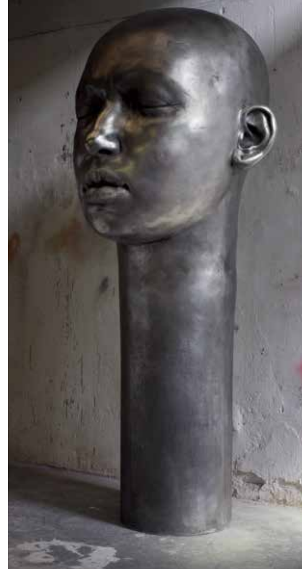
WATCHTOWER , 2015. Alumini. 225 x 95 x 105 cm