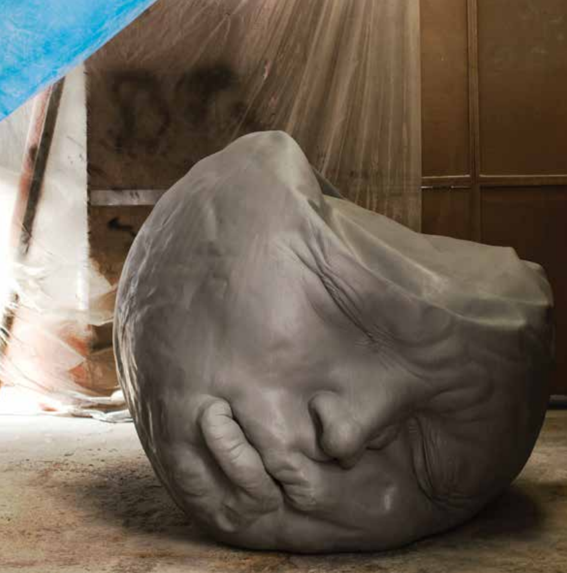
FALLEN , 2014. Resina de polièster. 130 x 150 x 150 cm