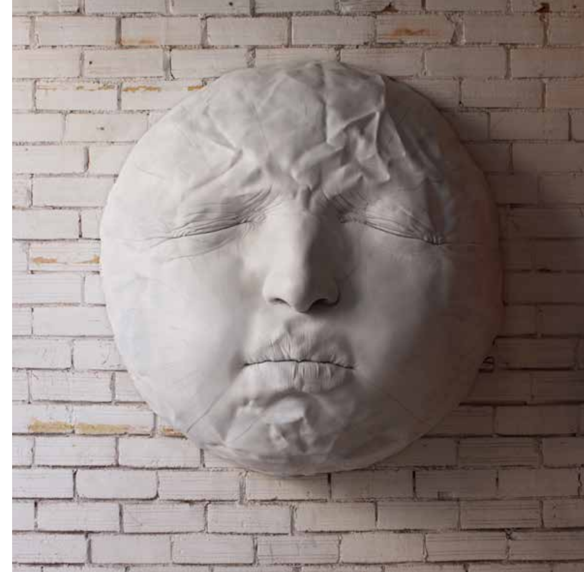
WANING MOON , 2014. Resina de polièster. 150 x 150 x 70 cm