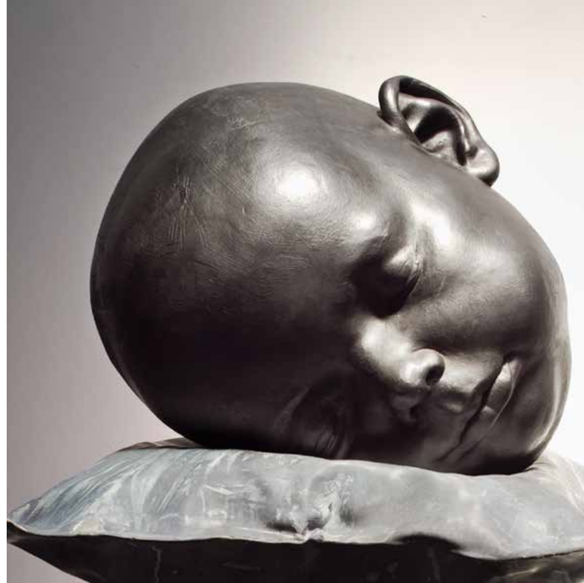
TRAUM , 2011. Alumini i plom. 60 x 60 x 75 cm