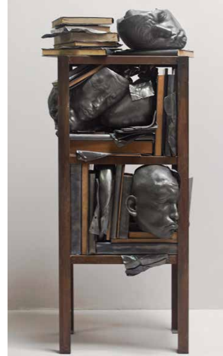
TIME , 2013. Resina de polièster, fusta, plom i ferro. 125 x 55 x 35 cm