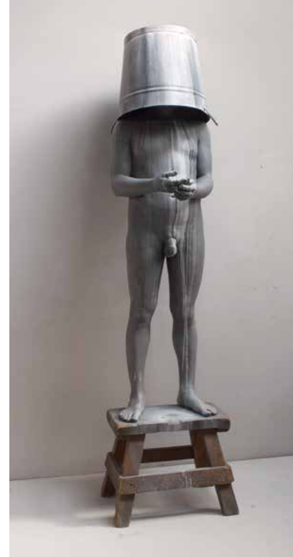
YOURS , 2014. Resina epoxi, fusta i galleda. 230 x 50 x 60 cm